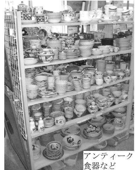
アンティーク 食器など