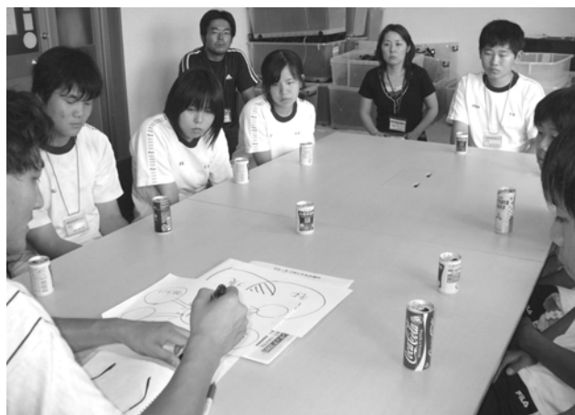
徳島中学校・国府中学校 体験学習