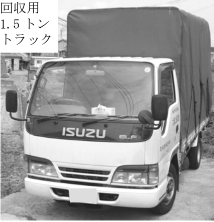
回収用 1.5トン トラック