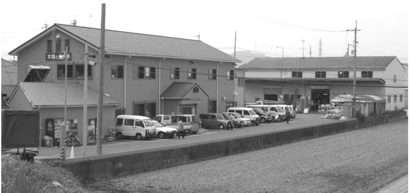
太陽と緑の会事務局・店舗兼作業所全景(左から掘り出し物コーナー、新館、作業倉庫)