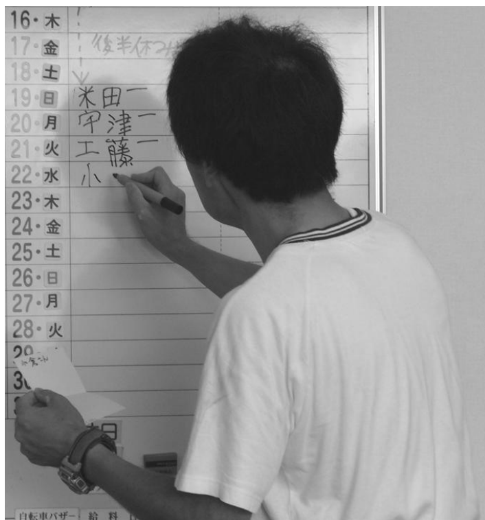
メンバーが選ぶ特別賞 開票結果を見つめる

メンバー選考枠は、時給が高い人だけに票が集まるということではなく、メンバー各自の視点から頑張っていると思われる人に投票されたように思います。スタッフが入らないという点がメンバーには新鮮だったようで、開票の時にはかなり盛り上がりを見せました。少しずつ改善しながら継続して行く予定です。