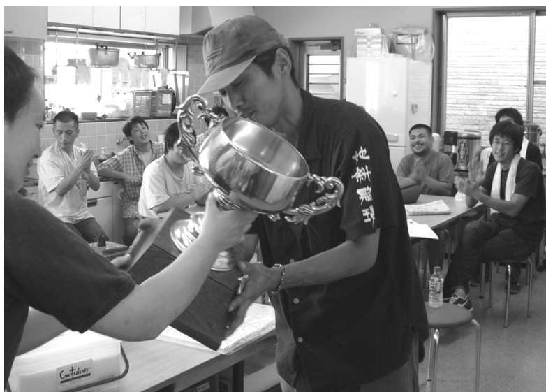
トロフィーと副賞の贈呈