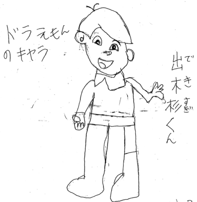
イラスト 阿部さん