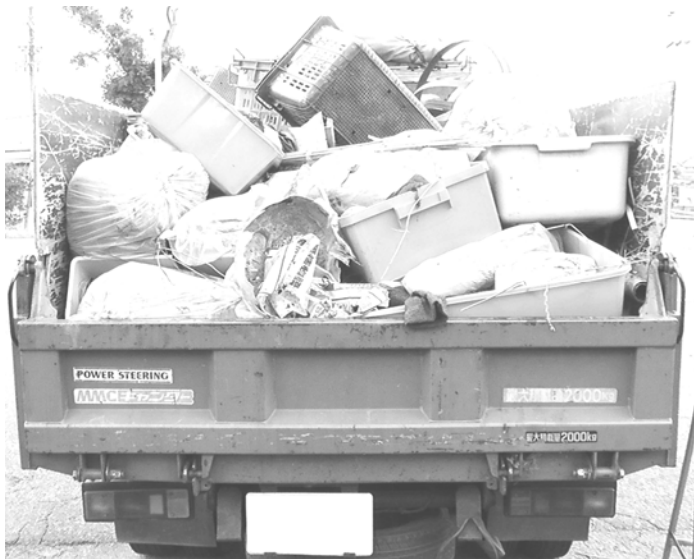
様々なハンディを持ったメンバーも汗を流しました