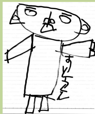
イラスト 走川さん