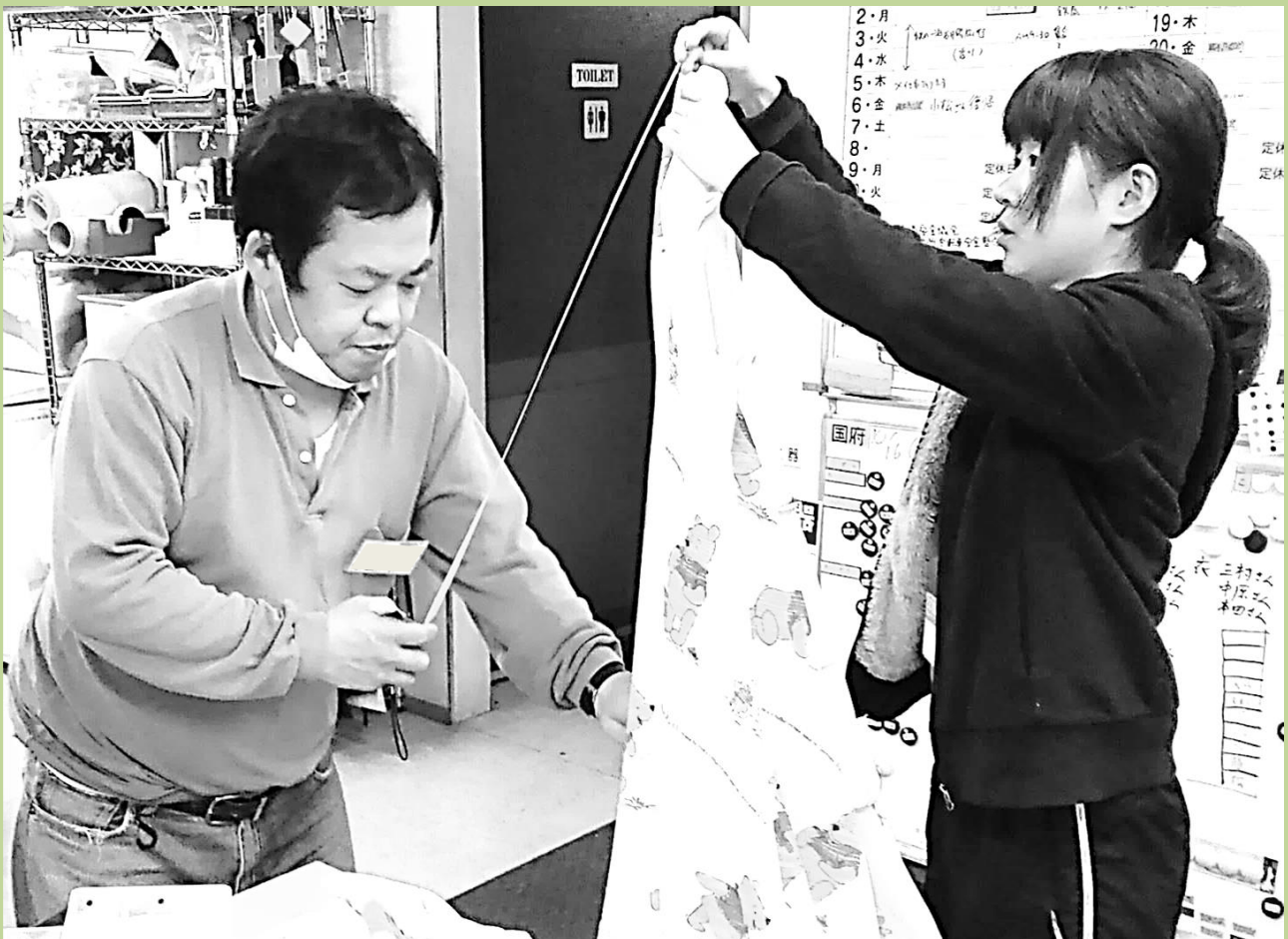
徳島県職員 NPO 研修 販売するカーテンの長さを測り、ショーカードに記入します。

「相模原で30数年地域福祉をやっている者です。80年代に相模原には地域作業所しかなかった。通所施設は全くなかったです。・・・でも20数年前に津久井やまゆりが建て替えをした時は、あんなすてきな立派な施設に、いずれはあそこに入りたい。通所に通っている人たちは短期入所を希望してショートスティを利用しながら入所を待っている方もいました。でも親御さんたちはグループホームを作り続けてきました。・・・現在11か所で130