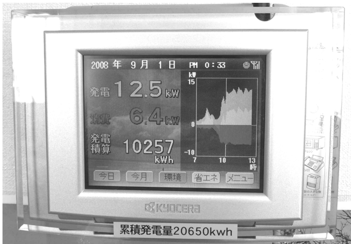
太陽光発電モニター。レジ横に設置し、市民の皆様にご覧いただけます。タッチパネル操作もできます。

事務局・作業所兼店舗のエコハウスにおけるCO 2 削減に向けた取り組み、及び24年間にわたる不用品・資源ごみのリユース・リサイクル事業の取り組みが評価されての受賞であり、当会を支えて下さっているすべての皆様のおかげです。本当にありがとうございました。