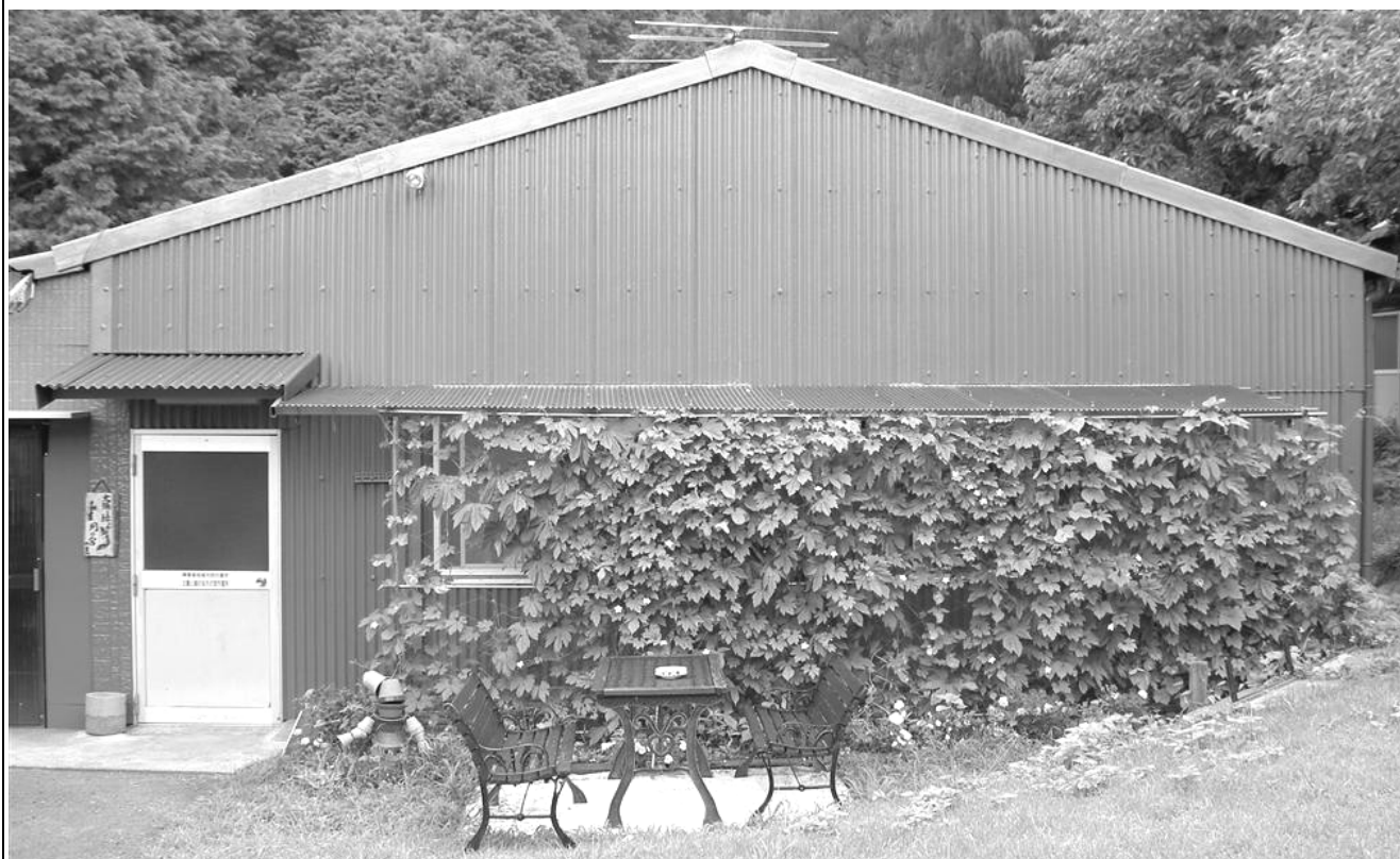
障害者地域共同作業所 太陽と緑の会月の宮作業所（ゴーヤカーテンでCO 2 削減）

6月11日付日経新聞四国版の四国経済欄のコーナー「四国の環境力」にて、太陽と緑の会のエコハウスの取り組みが紹介されました。同コーナーで取り上げて頂くのは、平成20年2月28日付朝刊以来、2回目です。